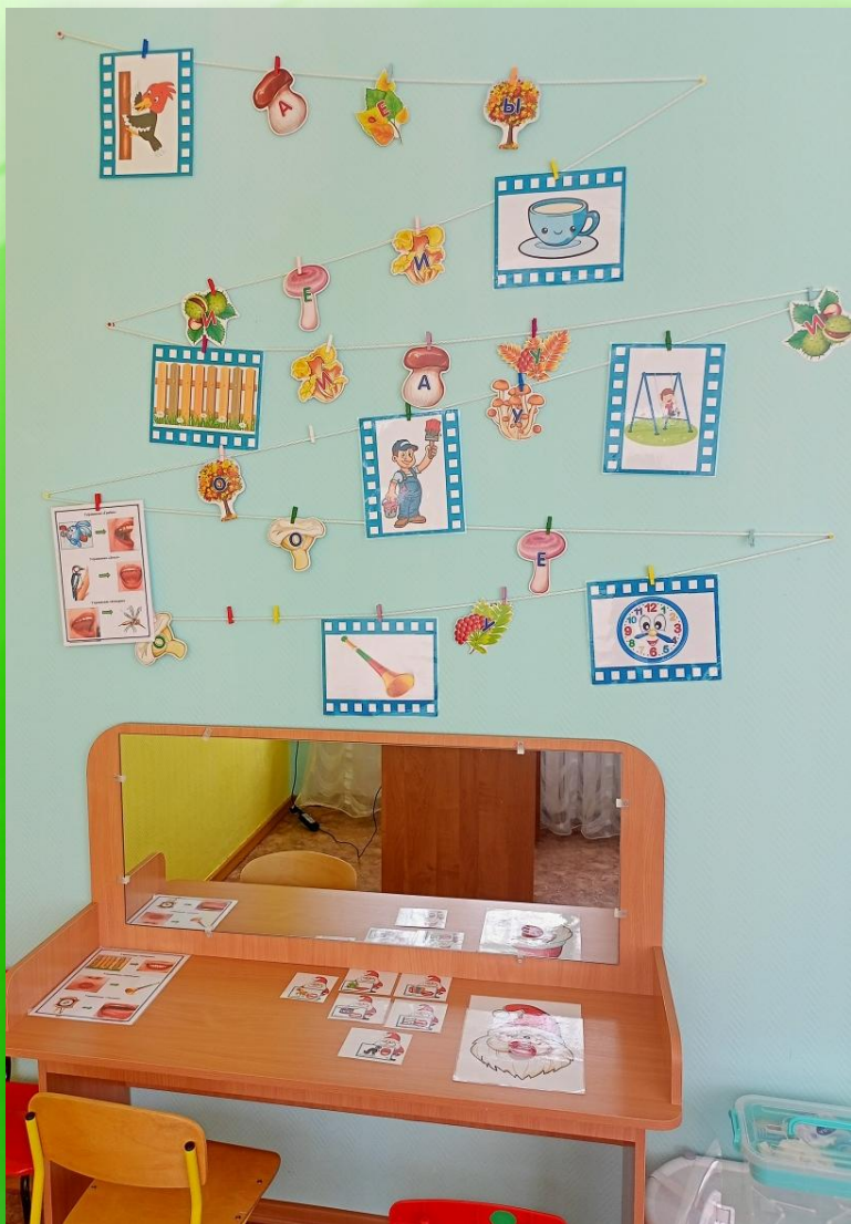
Зона коррекции звукопроизношения