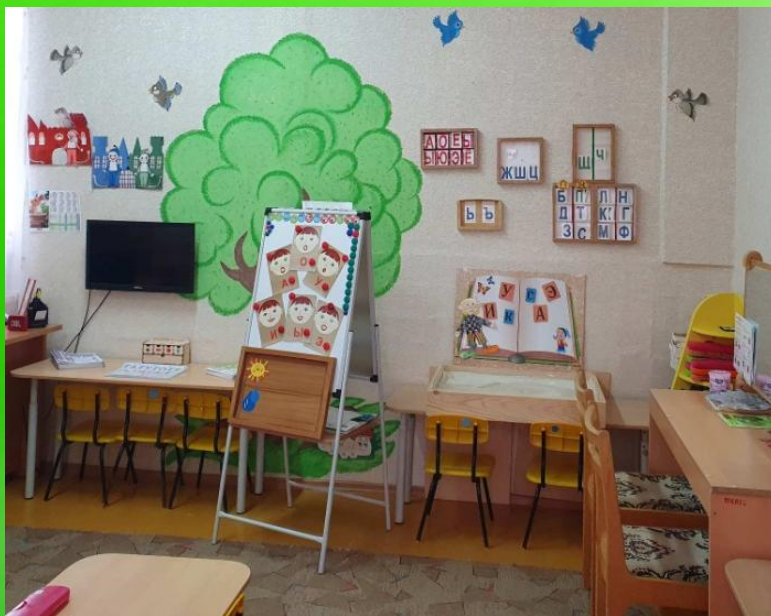
Зона коррекции звукопроизношения;