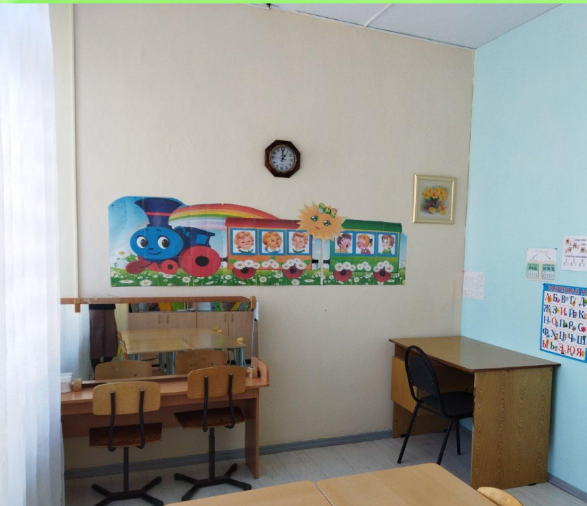
Рабочая зона учителя-логопеда